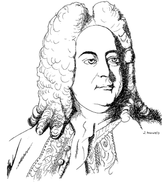
Georg Friedrich Händel (1685 - 1759)

D'entre les obres instrumentals, que són menys, són famoses la "Música aquàtica", escrita per acompanyar el rei Jordi I en els passeigs en barca pel Tàmesi, i la "Música pels Reials Focs d'Artifici", composta per les festes de celebració del tractat d'Aquisgrà.